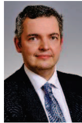
Nuno Alves (Head DEE-Departamento de Estudos Económicos, Bank of Portugal, ECB)