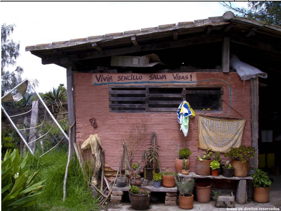
Figura 2 - Vivir sencillo salva vidas!

Está claro que como seres humanos, como arquitectos, somos producto de una sociedad en la que estamos inmersos: respondemos a un entorno. La realidad de incertidumbre que vivimos en Ecuador, empieza a convertirse en la realidad del mundo. Ya no tiene sentido hablar de otra arquitectura que no sea la que busque optimizar los recursos económicos, ambientales y sociales. Es más indispensable que nunca, no caer en banalidades ni malgastar los presupuestos que siempre son escasos.