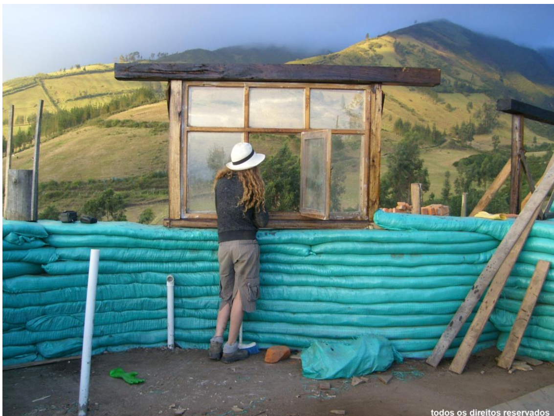
Figura 1 – Una ventana

Keywords: Crisis, Al Borde, Architecture, Latin America