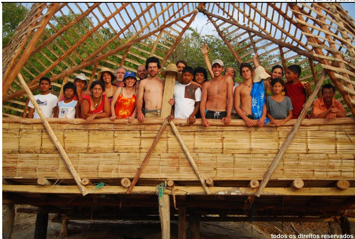
Figura 5 - Con los voluntarios en la construcción de la Escual Nueva Esperanza

1 Reunión de amigos e vecinos para hacer un trabajo comunitário.